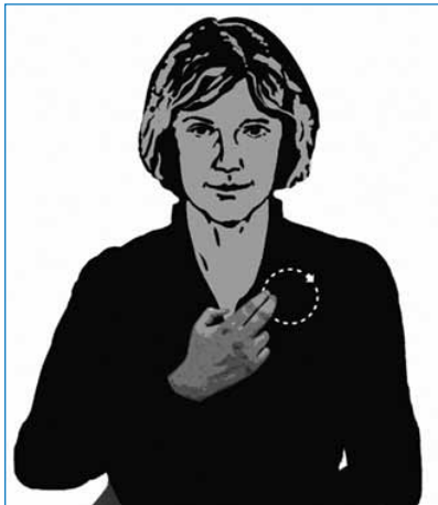
Abbildung 1: Selbstakzeptanzübung (aus: Eschenröder, C. T. & Wilhelm-Gößling, C. (2012). Energetische Psychotherapie – integrativ (S. 326). Tübingen: dgvt-Verlag)

peutische Vorgehen enthält im Allgemeinen die folgenden Elemente: